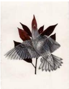
Steven SALVAT, Fusain éclatant et Jaseur Boréal , Encre de Chine et véritable plante sur papier 21x29.7m

Comment l'intégration d'un élément végétal peut-il transformer un dessin en une image poétique ?