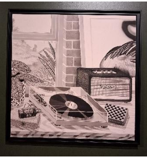
SHANE, Platine Techniques mixtes 100x100cm

Comment associer des objets du passé et d'aujourd'hui pour créer une image surprenante ?