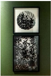
Mlle Terite, «_RB_03» et « Ombres et lumière », Papier découpé

Comment le vide peut-il produire du sens ? Découper, est-ce encore dessiner ?