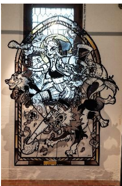
Williann, Vitrail « Le Petit Chaperon Rouge », technique mixte sur plaque de PMMA 107x140 cm

Comment un dessin peut-il transformer l'espace grâce à la lumière ? Aborder le dessin comme moyen de représentation étendu, qui dépasse le support et agit sur la perception de l'espace.