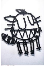
MONSTA, Gribouillage 01, sculpture murale bois découpé.

Comment un geste dessiné peut-il devenir une forme dans l'espace ?