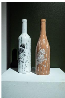
Steeven Salvat « Soliflores 1 et 3 » Encre de Chine sur Bouteille Peinte et vernie 9x30cm

Comment intégrer un élément figuratif dans un support ou un espace donné, en jouant avec le réel, l'illusion et le contexte ?