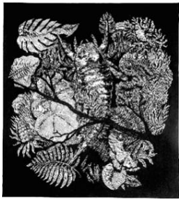
VADERETRO, « DÉMON » encre + pointe fine sur papier 29.7x42 cm

Comment le geste et la technique contribuent à rendre expressive la représentation d'un monstre ?