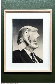
SHANE, « The Comedians » Techniques mixtes 35x55cm

Comment utiliser des objets et des images du quotidien pour créer une image qui reflète, critique ou interroge notre société ? Questionner la place de l'objet fonctionnel et de l'objet artistique ainsi que le statut des images.