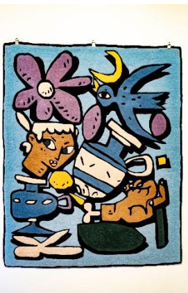
Philanthropes, « EQUILIBRE » Tapis tufté laine

Comment les techniques, les matériaux et les supports traditionnels peuvent-ils servir à créer des motifs contemporains et expressifs ?